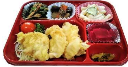
ふんわりボリューム◎ 鶏天弁当♪

★お電話を頂いてからご用意致しますので、引き続き 10時まで に連絡をして頂くようお願い致します。